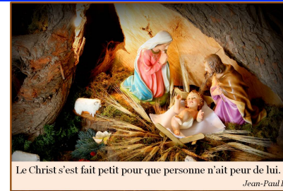
Le Christ s'est fait petit pour que personne n'ait peur de lui. Jean-Paul II