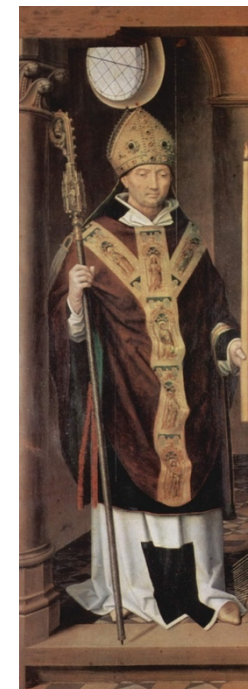
Martyr en Arménie

3 Donne-moi de T'aimer, de me laisser façonner Ta présence est pour moi un débordement de joie Je veux vivre de Toi, contempler ton cœur de père Reposer près de Toi pour la vie éternelle