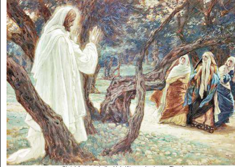
Christ Appears to the Holy Women by James Tissot

ÉVANGILE DE JESUS CHRIST SELON SAINT MATTHIEU (Mt 28, 1-10)