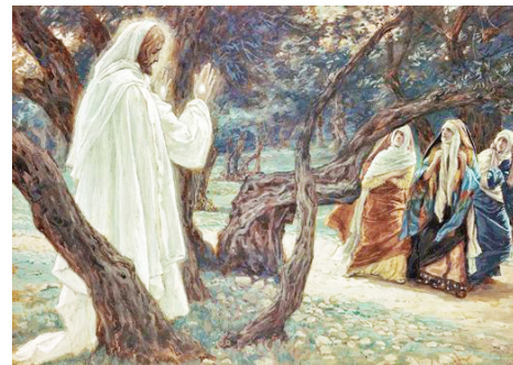
Christ Appears to the Holy Women by James Tissot

Après le sabbat, à l'heure où commençait à poindre le premier jour de la semaine, Marie Madeleine et l'autre Marie vinrent pour regarder le sépulcre. Et voilà qu'il y eut un grand tremblement de terre ; l'ange du Seigneur descendit du ciel, vint rouler la pierre et s'assit dessus. Il avait l'aspect de l'éclair, et son vêtement était blanc comme neige. Les gardes, dans la crainte qu'ils éprouvèrent, se mirent à trembler et devinrent comme morts. L'ange prit la parole et dit aux femmes : « Vous, soyez sans crainte ! Je sais que vous cherchez Jésus le Crucifié. Il n'est pas ici, car il est ressuscité, comme il l'avait dit. Venez voir l'endroit où il reposait. Puis, vite, allez dire à ses disciples : 'Il est ressuscité d'entre les morts, et voici qu'il vous précède en Galilée ; là, vous le verrez.' Voilà ce que j'avais à vous dire. » Vite, elles quittèrent le tombeau, remplies à la fois de crainte et d'une grande joie, et elles coururent porter la nouvelle à ses disciples. Et voici que Jésus vint à leur rencontre et leur dit : « Je vous salue. » Elles s'approchèrent, lui saisirent les pieds et se prosternèrent devant lui. Alors Jésus leur dit : « Soyez sans crainte, allez annoncer à mes frères qu'ils doivent se rendre en Galilée : c'est là qu'ils me verront. »