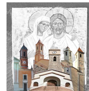
SAINT-ANDRÉ DE LA ROCHE