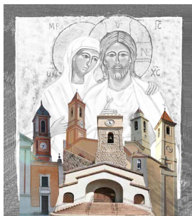
ANNÉES DE L'ESPRIT SAINT PENTECÔTE 2019/2021 2021 année saint Joseph