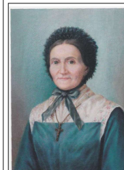
Sainte Marguerite Bays