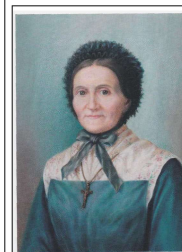
Sainte Marguerite Bays

TOURRETTE-LEVENS 2021 Année saint Joseph