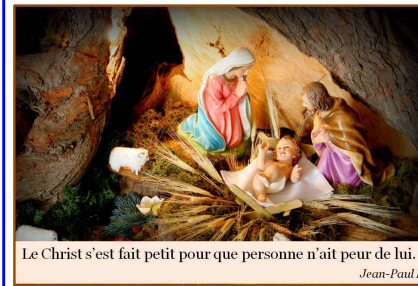
Le Christ s'est fait petit pour que personne n'ait peur de lui. Jean-Paul II

ACCLAMATION DE L'ÉVANGILE Alleluia, Magnificat