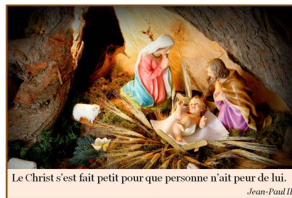
Le Christ s'est fait petit pour que personne n'ait peur de lui. Jean-Paul II

En ces jours-là, parut un édit de l'empereur Auguste, ordonnant de recenser toute la terre – ce premier recensement eut lieu lorsque Quirinius était gouverneur de Syrie. Et tous allaient se faire recenser, chacun dans sa ville d'origine. Joseph, lui aussi, monta de Galilée, depuis la ville de Nazareth, vers la Judée, jusqu'à la ville de David appelée Bethléem. Il était en effet de