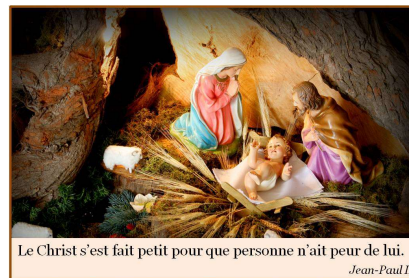
Le Christ s'est fait petit pour que personne n'ait peur de lui. Jean-Paul II

parut un édit de l'empereur Auguste, ordonnant de recenser toute la terre – ce premier recensement eut lieu lorsque Quirinius était gouverneur de Syrie. Et tous allaient se faire recenser, chacun dans sa ville d'origine. Joseph, lui aussi, monta de Galilée, depuis la ville de Nazareth, vers la Judée, jusqu'à la ville de David appelée Bethléem.