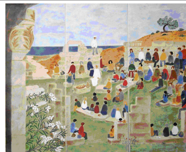
LA MULTIPLICATION DES PAINS