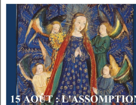
15 AOÛT : L'ASSOMPTION

La Vierge Marie, patronne principale de la France et patronne de la ville de Nice et du diocèse