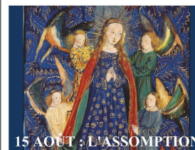
15 AOÛT : L'ASSOMPTION

La Vierge Marie, patronne principale de la France et patronne de la ville de Nice et du diocèse