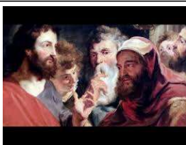
Dieu a tant aimé le monde

Celui qui fait le mal déteste la lumière : il ne vient pas à la lumière, de peur que ses œuvres ne soient dénoncées ; mais celui qui fait la vérité vient à la lumière, pour qu'il soit manifeste que ses œuvres ont été accomplies en union avec Dieu. »