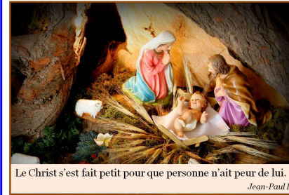
Le Christ s'est fait petit pour que personne n'ait peur de lui.