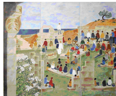
LA MULTIPLICATION DES PAINS

Les trois évangélistes Matthieu, Marc et Luc parlent souvent de miracles devant les gestes que Jésus pose ; Jean, comme dans l'Évangile d'aujourd'hui, parle lui de signe . Mais la foule d'aujourd'hui, dans le Discours sur le Pain de Vie qui va séparer ceux qui croient en Jésus et ceux qui s'y oppose, en reste au miracle ; elle en veut encore, elle n'est jamais rassasiée.