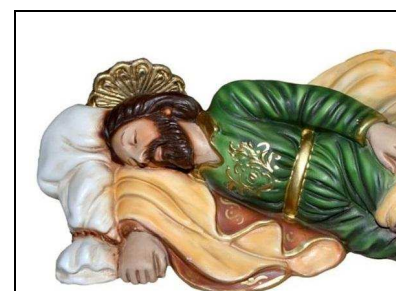
« Joseph endormi »

Ce dimanche nous entendrons l'Annonciation faite à Marie ; celle faite à Joseph est moins connue, pourtant par son Oui , Jésus « se fait dépendant de Joseph pour être défendu, protégé, soigné, élevé. Dieu fait confiance à cet homme, comme le fait Marie qui trouve en Joseph celui qui, non seulement veut lui sauver la vie, mais qui s'occupera toujours d'elle et de l'Enfant. En ce sens, Joseph ne peut pas ne pas être le Gardien de l'Église , parce que l'Église est le prolongement du Corps du Christ dans l'histoire, et en même temps dans la maternité de l'Église est esquissée la maternité de Marie . Joseph, en continuant de protéger l'Église, continue de protéger l'Enfant et sa mère , et nous aussi en aimant l'Église nous continuons d'aimer l'Enfant et sa mère . » Pape François, Lettre Apostolique sur Saint Joseph, à l'occasion du 150 ème anniversaire de la Déclaration de Saint Joseph comme Patron de l'Eglise universelle, du Pape Pie IX, le 8 décembre 1870.