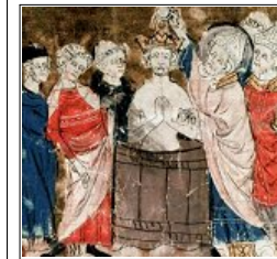
Baptême de Clovis

SAINT REMI, évêque de Reims, (mort vers 530)