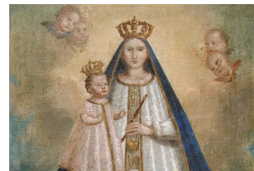
Notre Dame de Laghet

12h30 déjeuner sur place (sur inscription)