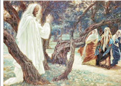
Christ Appears to the Holy Women by James Tissot

Après le sabbat, à l'heure où commençait à poindre le premier jour de la semaine, Marie Madeleine et l'autre Marie vinrent pour regarder le sépulcre. Et voilà qu'il y eut un grand tremblement de terre ; l'ange du Seigneur descendit du ciel, vint rouler la pierre et s'assit dessus. Il avait l'aspect de l'éclair,