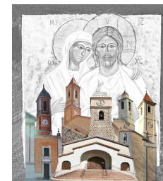
NATIVITE DE LA BIENHEUREUSE VIERGE MARIE