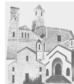
Saint-André de la Roche