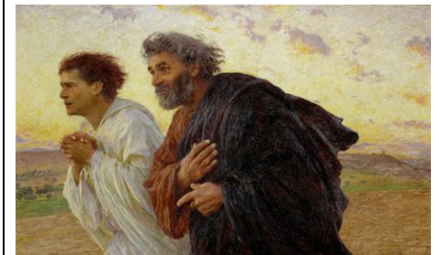
Simon-Pierre et Jean se rendent au tombeau

PRIERE UNIVERSELLE R/ « Par Jésus Christ, ressuscité, exauce-nous Seigneur. »