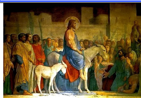
Entrée Messianique de Jésus à Jérusalem

... En ce temps-là, L'assemblée tout entière se leva, et on l'emmena chez Pilate. On se mit alors à l'accuser : « Nous avons trouvé cet homme en train de semer le trouble dans notre nation : il empêche de payer l'impôt à l'empereur, et il dit qu'il est le Christ, le Roi. » Pilate l'interrogea : « Es-tu le roi des Juifs ? » Jésus répondit : « C'est toi-même qui le dis. ». .... C'était déjà environ la sixième heure (c'est-à-dire : midi) ; l'obscurité se fit sur toute la terre jusqu'à la neuvième heure, car le soleil s'était caché. Le rideau du Sanctuaire se déchira par le milieu. Alors, Jésus poussa un grand cri : « Père, entre tes mains je remets mon esprit. » Et après avoir dit cela, il expira. (Ici on fléchit le genou et on s'arrête un instant) À la vue de ce qui s'était passé, le centurion rendit gloire à Dieu : « Celui-ci était réellement un homme juste. » Et toute la foule des gens qui s'étaient rassemblés pour ce spectacle, observant ce qui se passait, s'en retournaient en se frappant la poitrine. Tous ses amis, ainsi que les femmes qui le suivaient depuis la Galilée, se tenaient plus loin pour regarder.