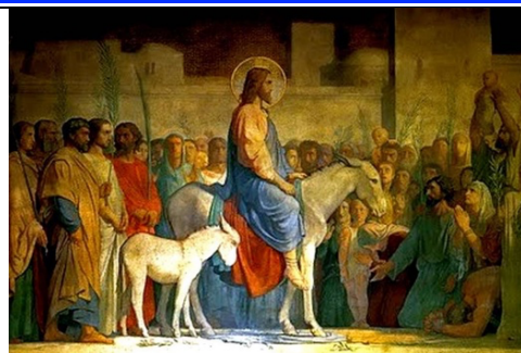
Entrée Messianique de Jésus à Jerusalem

À la vue de ce qui s'était passé, le centurion rendit gloire à Dieu : « Celui-ci était réellement un homme juste. » Et toute la foule des gens qui s'étaient rassemblés pour ce spectacle, observant ce qui se passait, s'en retournaient en se frappant la poitrine. Tous ses amis, ainsi que les femmes qui le suivaient depuis la Galilée, se tenaient plus loin pour regarder.