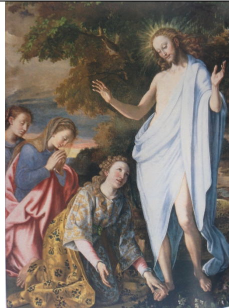
Pourquoi cherchez-vous le Vivant parmi les morts

Revenues du tombeau, elles rapportèrent tout cela aux Onze et à tous les autres. C'étaient Marie Madeleine, Jeanne, et Marie mère de Jacques ; les autres femmes qui les accompagnaient disaient la même chose aux Apôtres. Mais ces propos leur semblèrent délirants, et ils ne les croyaient pas. Alors Pierre se leva et courut au tombeau ; mais en se penchant, il vit les linges, et eux seuls. Il s'en retourna chez lui, tout étonné de ce qui était arrivé.