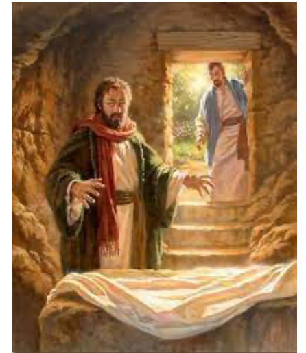
Alors Pierre se leva et courut au tombeau ; mais en se penchant, il vit les linges, et eux seuls.