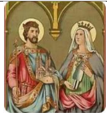
Saint Henri et Sainte Cunégonde

(Lettre de saint Henri à l'évêque de Bamberg)