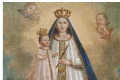
Notre Dame de Laghet

12h30 déjeuner sur place (sur inscription)