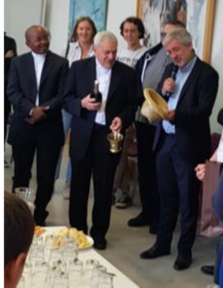
Moment convivial après la célébration