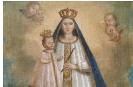
Notre Dame de Laghet

12h30 déjeuner sur place (sur inscription)