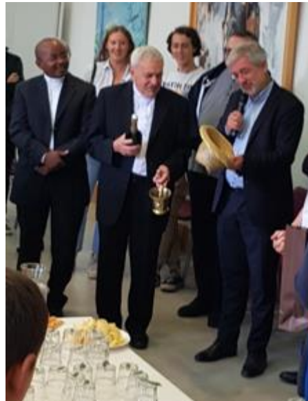
Moment convivial après la célébration