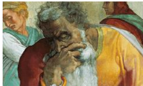
Jérémie doute... (Chapelle Sixtine)

pour arracher et renverser, pour détruire et démolir, pour bâtir et planter. »