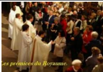
Les prémices du Royaume.