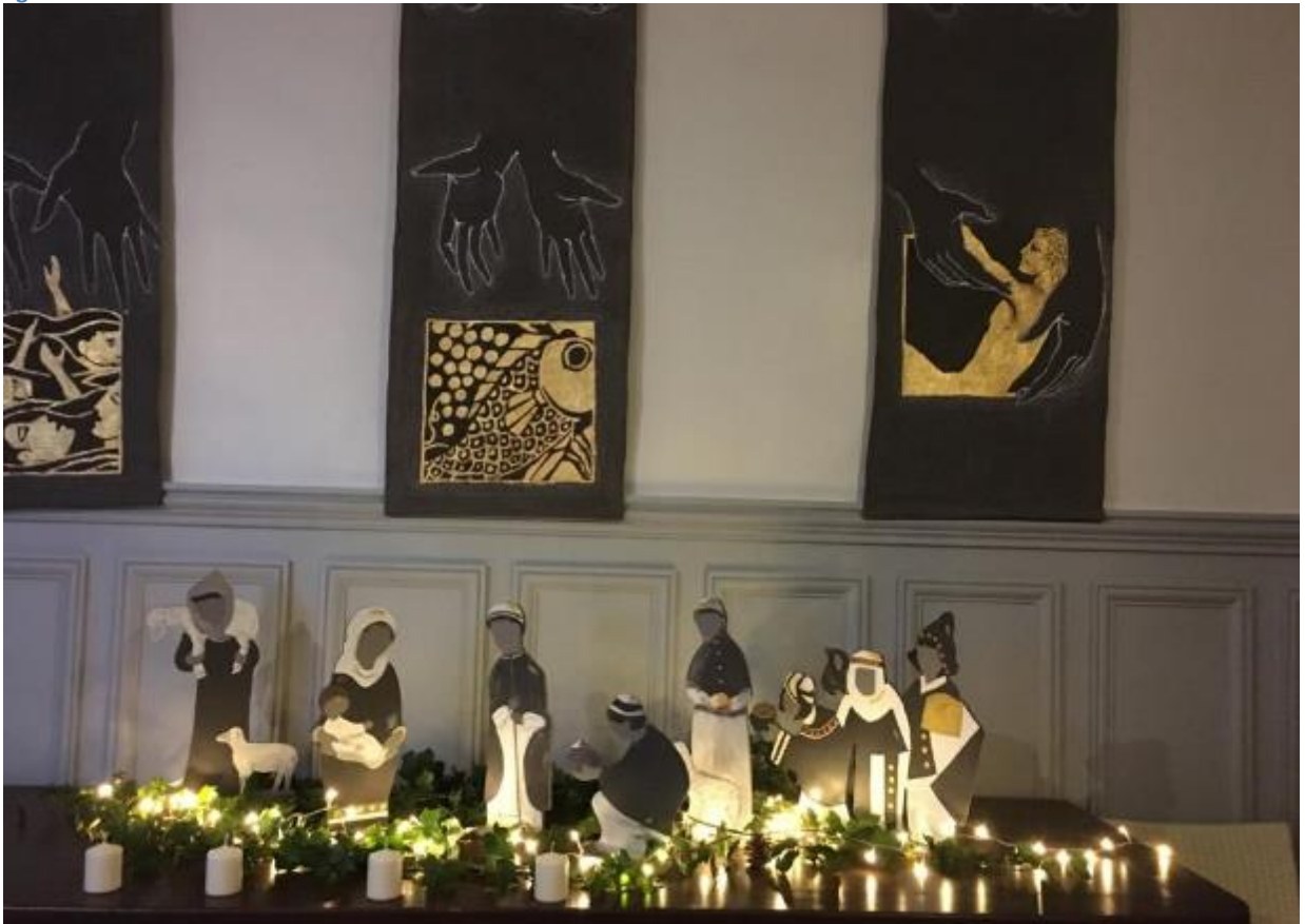
Presbytère de la cathédrale Saint Louis de Versailles