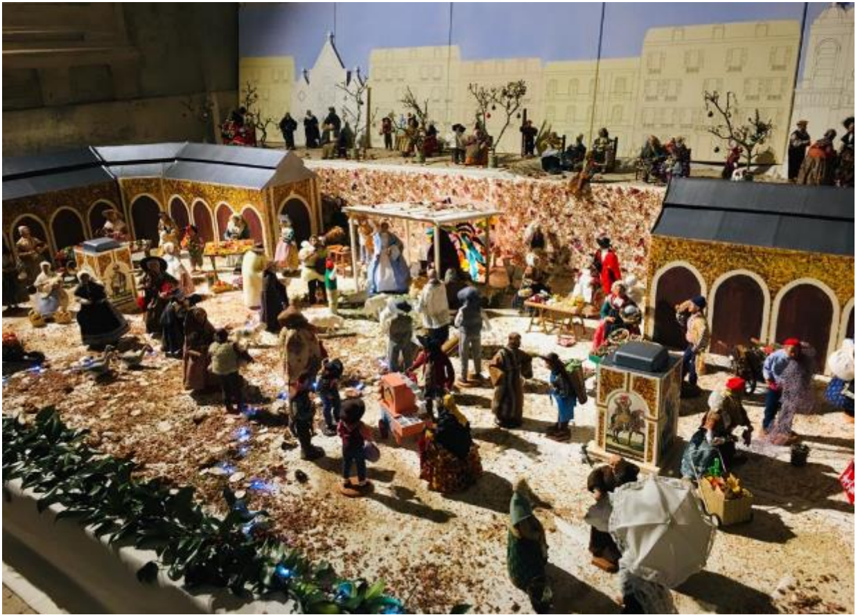
Eglise Notre Dame de Versailles