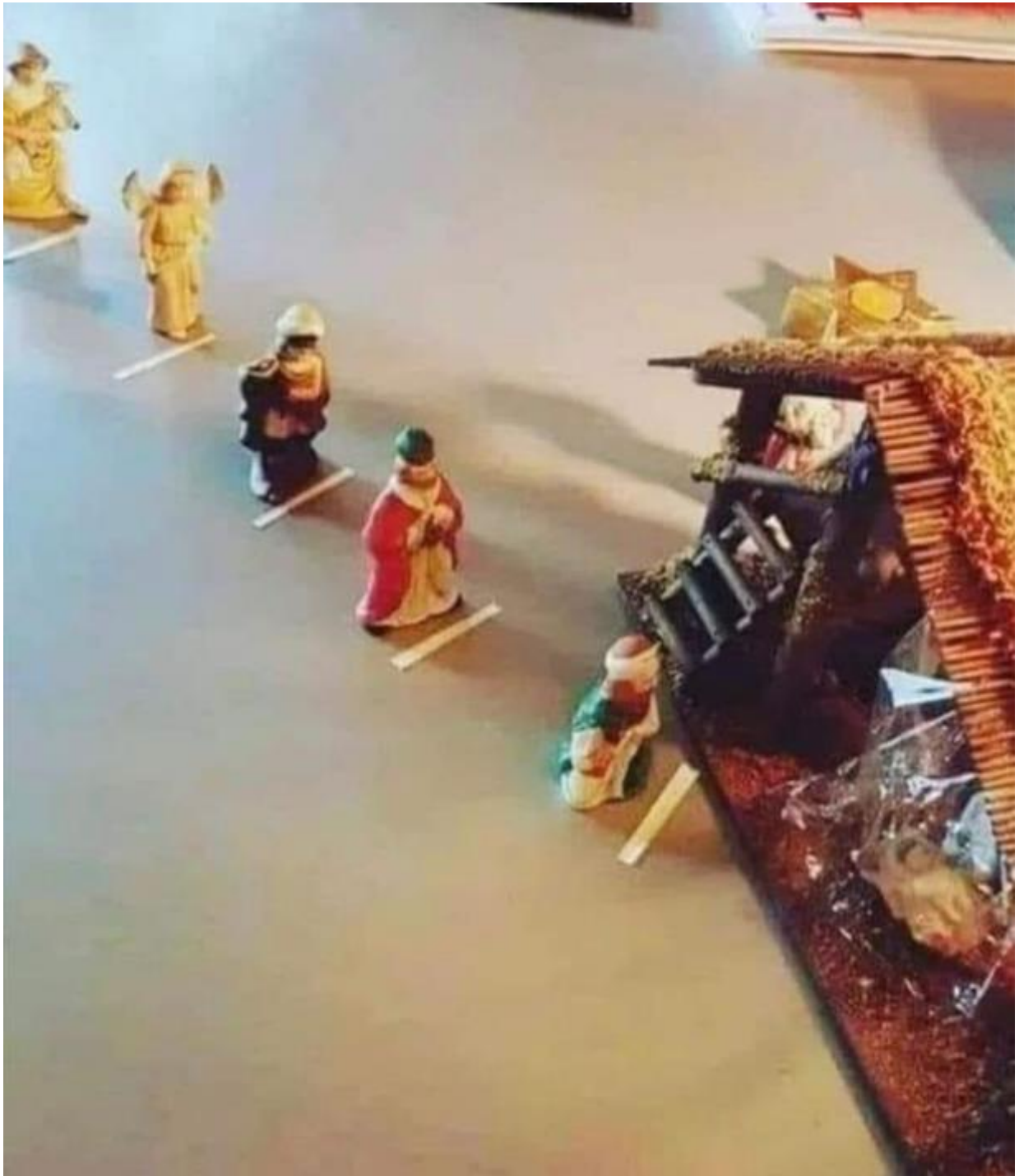
Un clin d'oeil! A appliquer lors des célébrations...