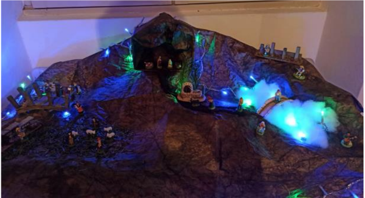
Crèche de Charlotte et Arnaud