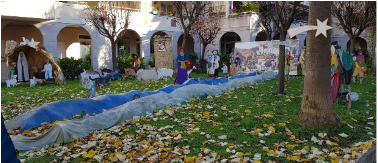
Crèche devant la mairie de Saint André de la Roche