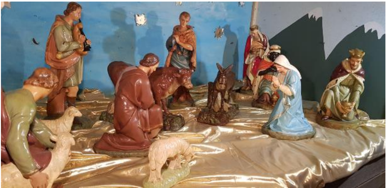
Crèche de l'église Saint-André