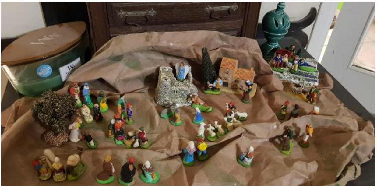
Crèche famille Roux