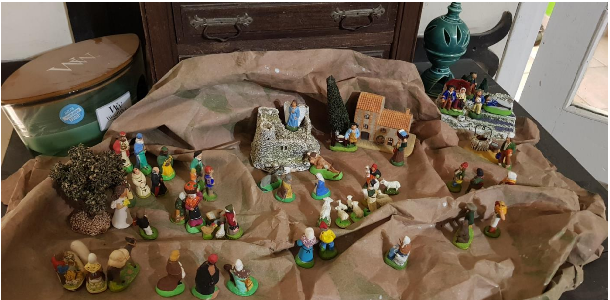
Crèche famille Roux