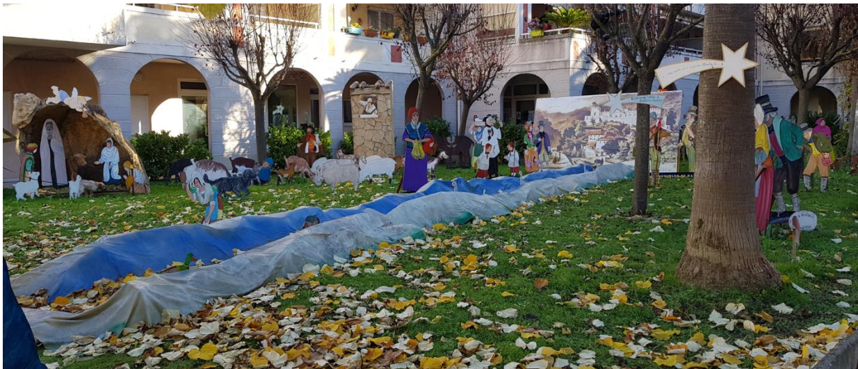
Crèche devant la mairie de Saint André de la Roche

Pour s'abonner (ou se désabonner) à « Saint Pons Infos », pour faire des propositions, envoyer un mail à saintponsinfo@yahoo.com