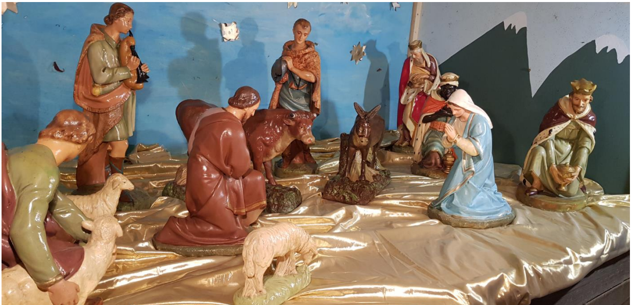
Crèche de l'église Saint-André