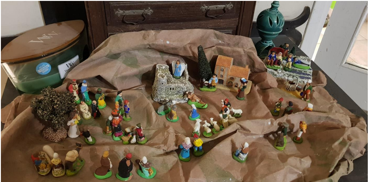
Crèche famille Roux