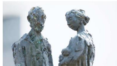
« Sans Dorothee - son épouse -, il n'y aurait pas eu de saint Nicolas de Flüe »