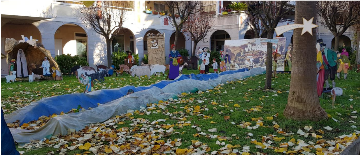
Crèche devant la mairie de Saint André de la Roche

Pour s'abonner (ou se désabonner) à « Saint Pons Infos », pour faire des propositions, envoyer un mail à saintponsinfo@yahoo.com