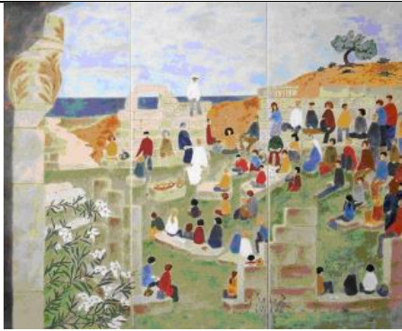
LA MULTIPLICATION DES PAINS