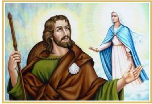
Saint Jacques le Majeur O.D.M. pinxit