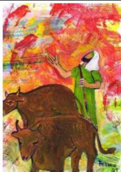
AMOS était bouvier

Toi, le voyant, va-t'en d'ici... Amos 7, 12