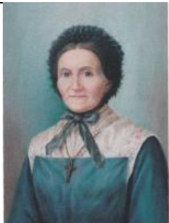
Sainte Marguerite Bays