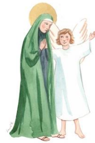
Ste Françoise Romaine

(Témoignage de l'un de ses contemporains)