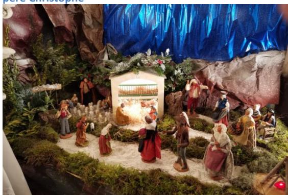
chapelle de l'Abadie