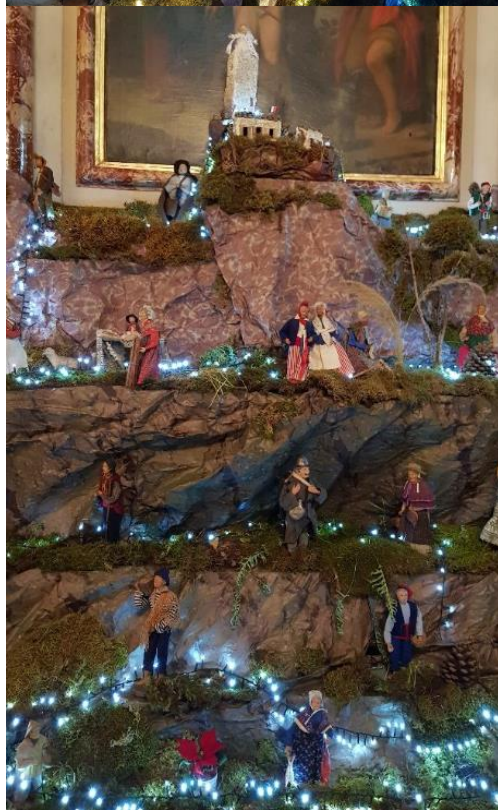
Un tout petit peu de Tourrette-Levens !