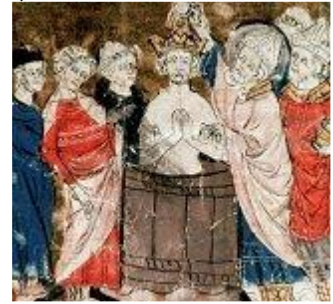
Baptême de Clovis

Saint Rémi, « l'apôtre des Francs » était fêté le 1er Octobre jusqu'à la Réforme liturgique de 1969. Actuellement fêté le 15 janvier, date probable de sa mort. Le 1er octobre était le jour qui rappelait la translation de ses reliques d'Épernay à Reims, par le pape Léon IX lui-même. Bien que célèbre en France, saint Rémi (ou Remy) est mal connu. Fils de sainte Céline, il est né vers 440, près de Laon (Aisne), dans une grande famille gallo-romaine, et a reçu une bonne éducation.