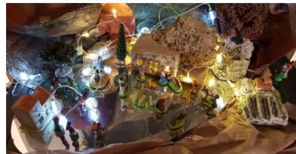
famille roux Aspremont