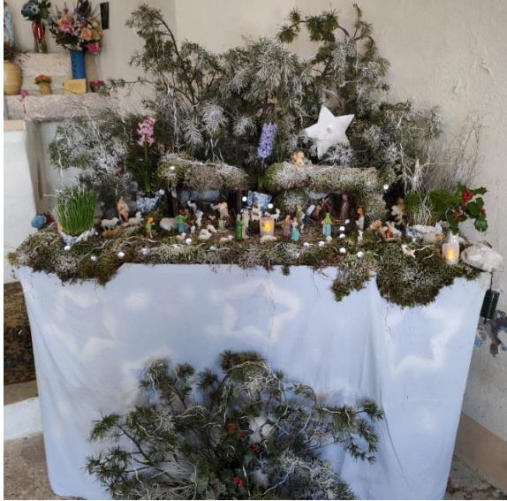
Saint Michel de Roccasparviera