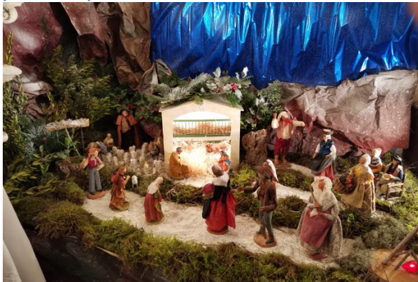
chapelle de l'Abadie