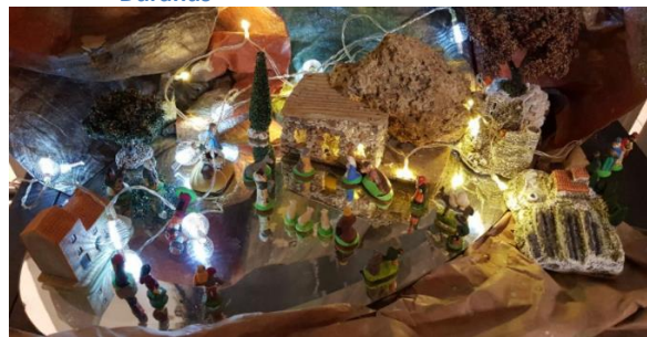
famille roux Aspremont