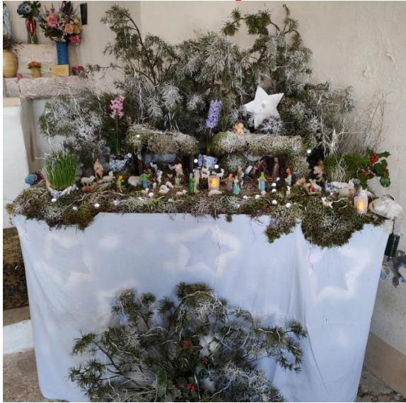
Saint Michel de Roccasparviera